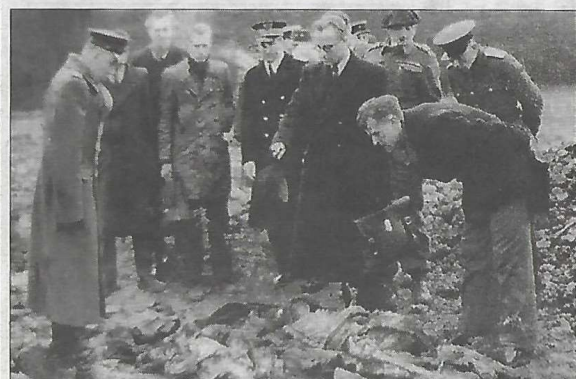
Après la libération, les autorités découvrent les charniers de soldats soviétiques sur le site du Ban Saint-Jean.