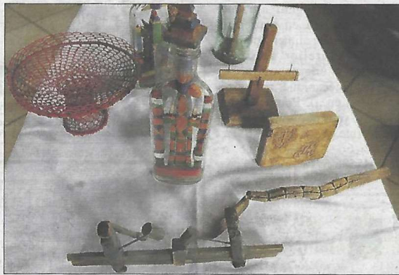
Les prisonniers trop faibles, qui ne pouvaient pas sortir du camp, essayaient de survivre en fabriquant de petits objets qu'ils échangeaient contre de la nourriture avec ceux travaillant dans les fermes.