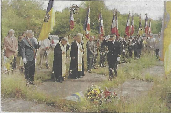
L'association franco-ukrainienne est à l'initiative du maintien de la mémoire de cet épisode méconnu de la Seconde Guerre mondiale en France.

La présence de ces prisonniers au camp de Denting s'intègre dans une longue histoire qui mérite d'être évoquée. Ce camp - un camp de sûreté - avait été construit dans les années 30, dans le cadre des ouvrages de la Ligne Maginot. Il hébergeait le 146 e Régiment d'Infanterie de Forteresse. Une fois l'armistice de juin 1940 signé, il passe aux mains des Allemands qui le transforment en camp de prisonniers français. Le sergent François Mitterrand y fera un bref séjour. Mais après l'opération Barbarossa, sa vocation de camp de détention de prisonniers soviétiques se précise : au départ les Allemands, déjà présents en Pologne, envahissent l'Ukraine où ils font des centaines de milliers de prisonniers. Ils commencent par exterminer ces « sous-hommes » slaves, puis se ravisent en disant qu'ils pourraient constituer une excellente