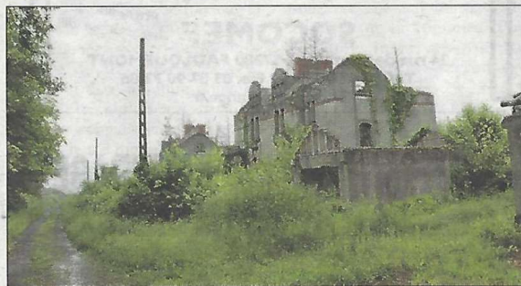
Le temps a fait son œuvre avec une végétation qui se développe, et un patrimoine bâti qui se détériore.

risques, certains en secourant les prisonniers de leur mieux. Quelques-uns méritent d'être cités : À Boulay, la boucherie-