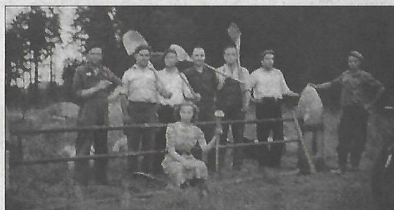
Création du cimetière par un groupe d'Ukrainiens, après guerre.