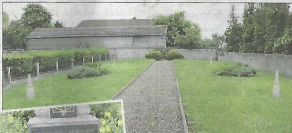
Le cimetière où reposent, dans des fosses communes, 3.600 soldats soviétiques décédés à l'hôpital militaire de Boulay. L'hôpital se situait à l'emplacement actuel de la zone commerciale de Boulay.