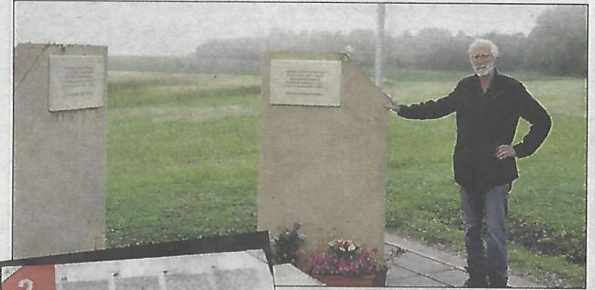
Le visiteur dispose sur les abords du site (Interdit d'accès) d'un parcours mémoriel constitué de plusieurs panneaux qui aboutissent à un monument.

Par la voie diplomatique, la France est invitée à mettre un terme à cette manifestation. La