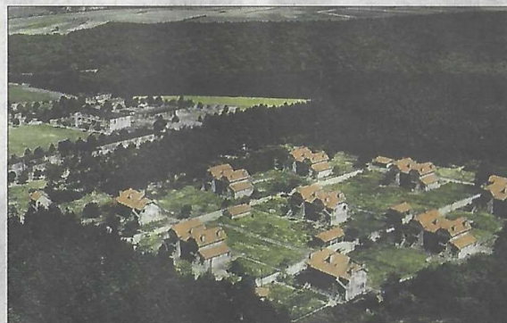
Le site du Ban Saint-Jean était une ville à part entière.