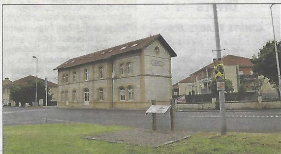
Les prisonniers soviétiques arrivant en Moselle descendent en gare de Boulay avant de rejoindre le camp du Ban Saint-Jean.

Deux conceptions des relations humaines s'entrechoquent. L'une, portée par les Allemands, passe son temps à brailler ses interdits tous azimuts, et l'autre - nos compatriotes, dans une fervente discrétion, s'expose à des