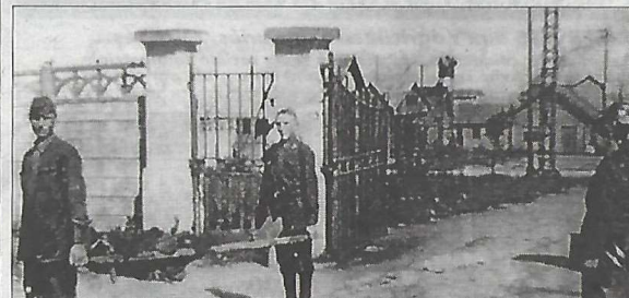
Le manque de nourriture et de soins médicaux, associé aux épidémies, vont entraîner une mortalité élevée dans le camp de prisonniers.